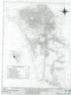
Figura 02. Mapa del Distrito de Ventanilla