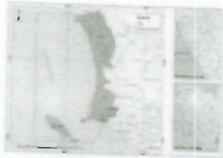
Figura 01. Mapa del Departamento Lima y Provincia del Callao

Sus límites son: Por el Norte : Ventanilla - Satélite Por el Sur : Refinería La Pampilla Por el Este : A. H. Parque Porcino Por el Oeste : Océano Pacífico